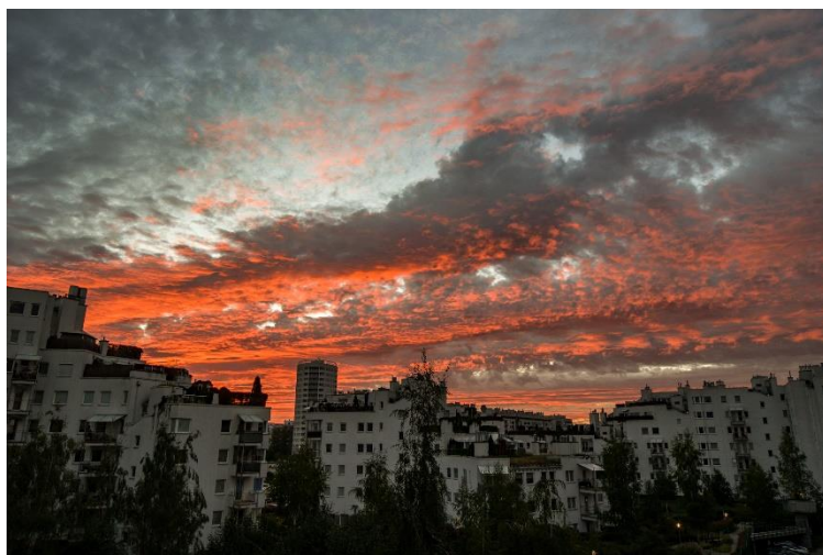
Ursynów budzi się do życia