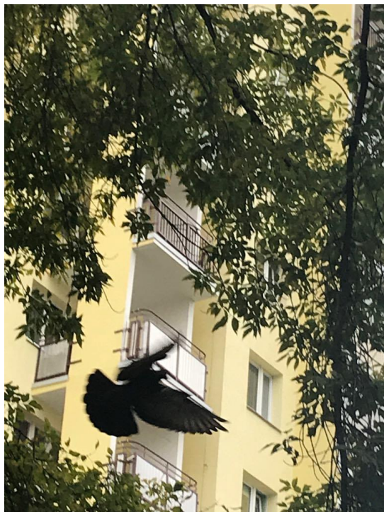
Lot ptaka nad Płaskowicką