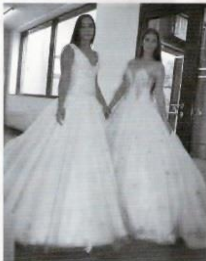
Tieto krásne šaty ocenil aj český porotcom.