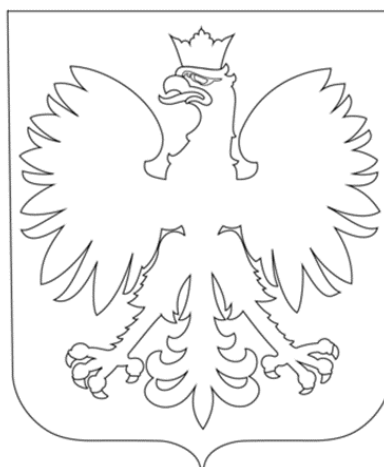
Coat of arms of Poland - White Eagle - Orzeł Biały Adopted 1295 and last modified in 1990 Stylized white eagle with a golden beak and talons, and wearing a golden crown, in a red shield.