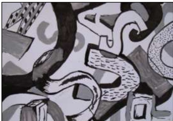
Tomáš Kokavec, 9.B