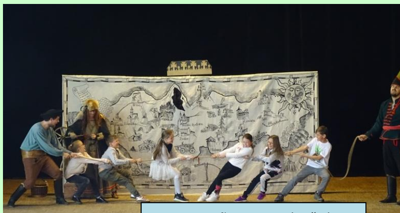
Tres compañeros zapojili i žiakov