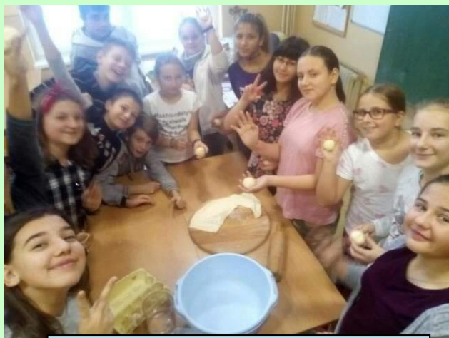
Šiestaci doržievajú zvyky pred Vianocami