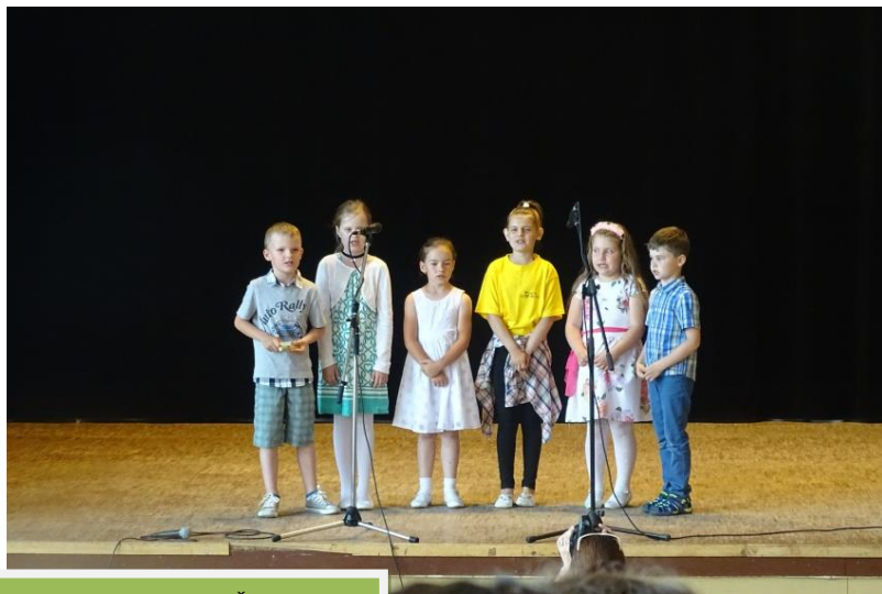
Malí speváci, koncert ZUŠ, jún 2019