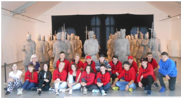
Deviatáci na výstave Terakotovej armády, jún 2019