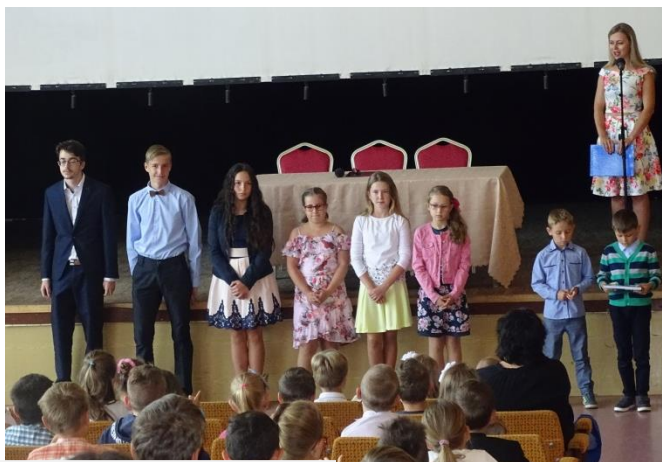
Najlepší žiaci z každej triedy, jún 2019