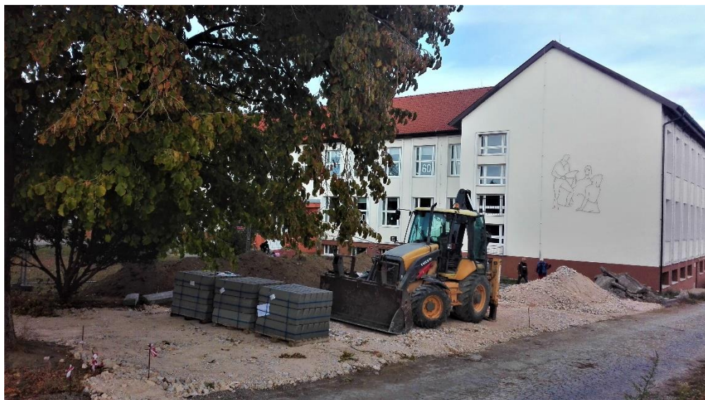
Výstavba parkoviska v priestoroch areálu školy