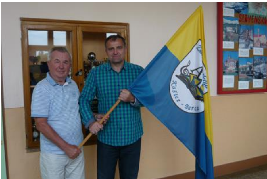
Odozdávanie „štafety“ na pozíciu riaditeľa školy.