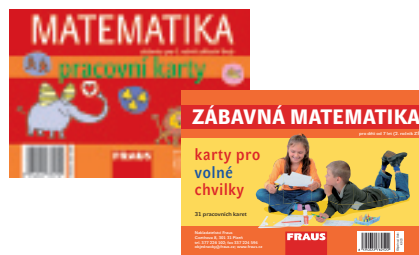
Pracovní karty pro domácí procvičování