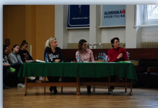
Porota SOČ 2019

Ďakujeme pani profesorkám, ktoré nadchli svojich žiakov, ktoré pracovali s nimi ako školitelia a priviedli ich k úspešnej prehliadke SOČ i reprezentácii vo vyššom kole. Vďaka nim 40-ročná tradícia úspešných SOČ na GLN pokračuje.