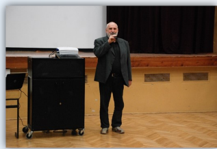
Slávnostný príhovor p. riaditeľa Kyndla

Práce mali vysokú úroveň a boli dôkazom toho, že láska k vede a poznaniu môže byť životnou vášňou a štýlom súčasne.