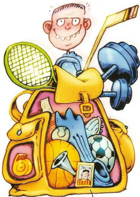
OBLÚBENÝ FUTBALISTA (FOTKA S PODPISOM)

Nosí výhradne športovú tašku. A kompletnú výbavu: náhradné tepláky, kopačky, rôzne druhy lôpt, raketu, stopky, píšťalku, plutvy, závažie a kyslíkovú bombu. Knihy a zošity má so sebou len vtedy, keď mu na ne ostane miesto (čítaj: nenosí ich so sebou nikdy). Ak je téma Môj šťastný deň , píše o víťazstve svojho klubu. Pozná naspamäť výsledky všetkých súťaží. Nájdeš ho na športoviskách, v knižnici nikdy.