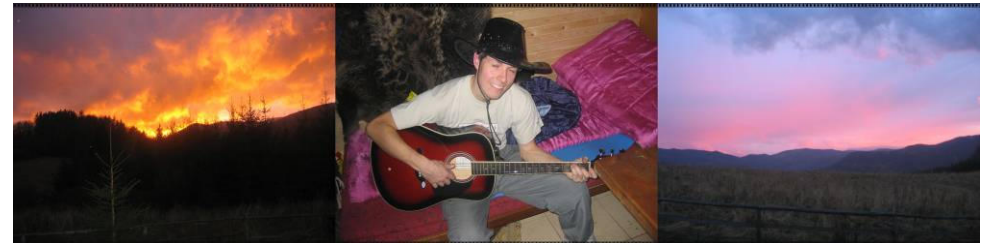
Príroda v plnej kráse