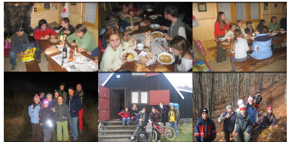
Výlet na Dutú skalu a foto pred chatou