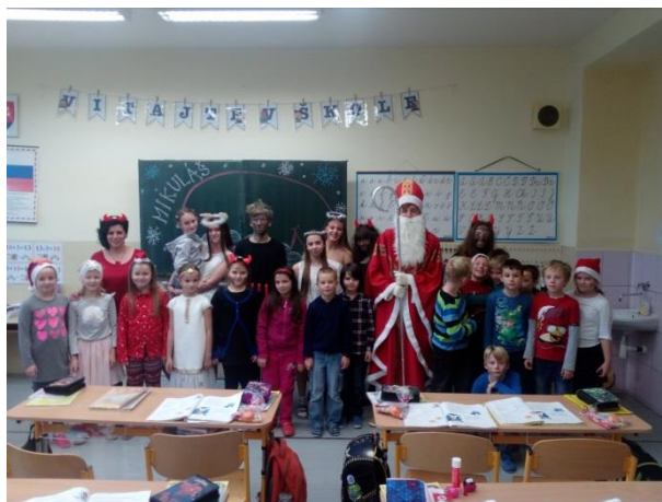
Mikuláš, anjeli a čerti