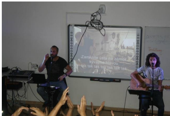
Hudobno-ýchovný koncert: Potulky Slovenskom