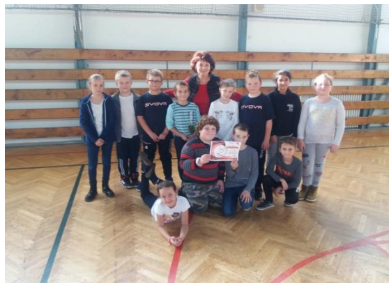
Okresné kolo vo Vybíjaní