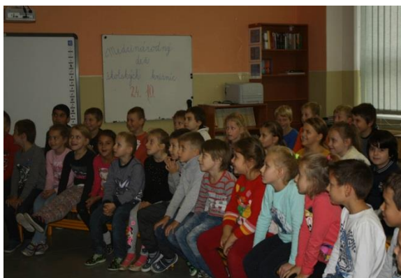
Medzinárodný deň školských knižníc