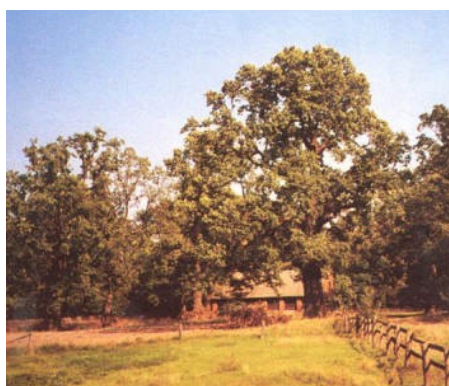
Wieś Siemiony— skupisko dębów przy leśniczówce

Pismo wydawane przez Zespół Szkół w Grodzisku