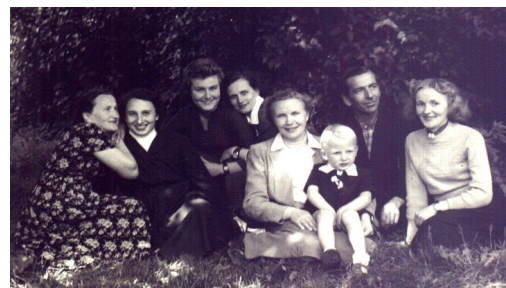
Rada Pedagogiczna - rok 1958