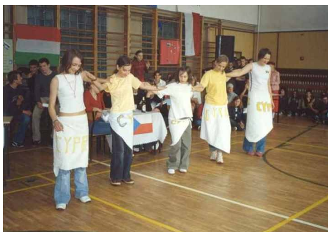
Uczennice z klasy I C G tańczą „Zorbę”. Reprezentują Cypr