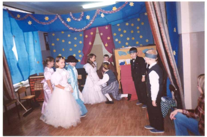
Przedstawienie „Kopciuszek” w wykonaniu klasy I