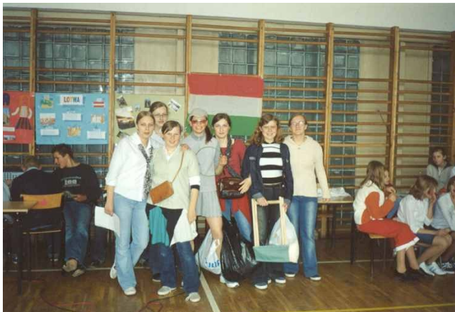
Uczennice klasy III C G nie tylko świetnie wychodzą na zdjęciach. Dzielnie prezentowały

W naszej szkole świętowaliśmy wejście Polski do Unii Europejskiej. Oto krótki fotoreportaż z tego dnia.