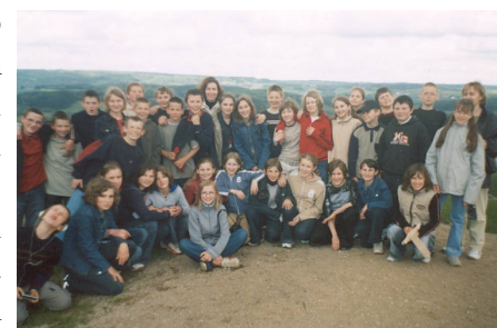
Uczestnicy wyjazdu z opiekunkami