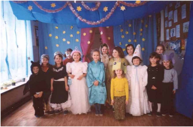
Bal przebierańców—oto jak przebrały się dziewczynki.

W Szkole Podstawowej w Stadnikach dzieje się jak zwykle dużo i ciekawie. Oto krótki fotoreportaż