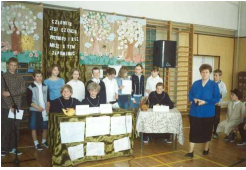
Apel o treści ekologicznej przygotowany przez klasy VI A i B