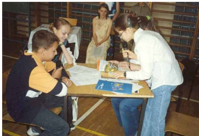
Dokąd warto wyjechać na wakacje! Z pewnością na Cypr!