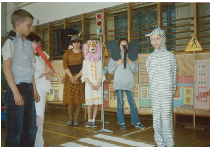
Uczniowie klasy IV A SP podczas apelu o bezpieczeństwie