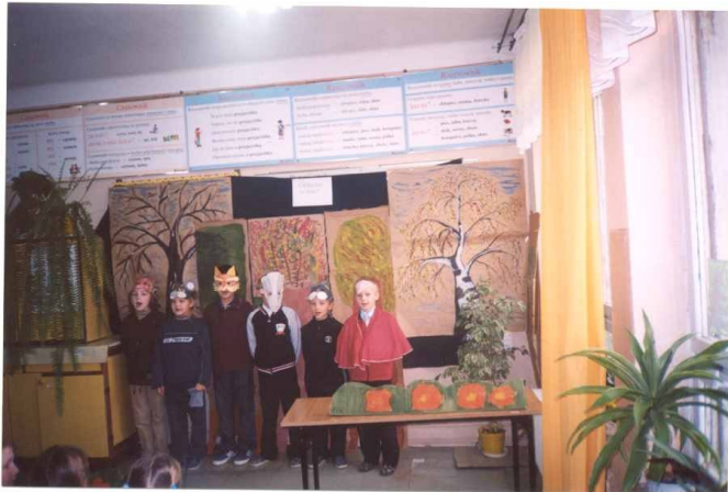
„Co słyhać w lesie?” - inscenizacja drugoklasistów