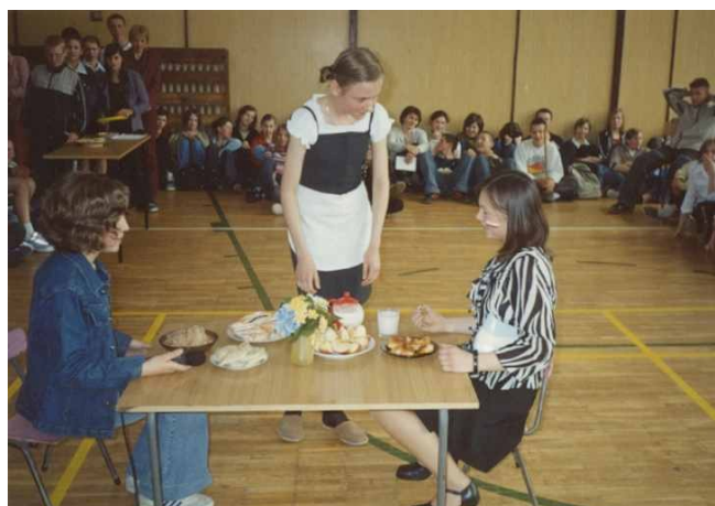
Polska kuchnia najlepsza pod słońcem! Uczennice klasy VI B SP miały okazję się o tym przekonać