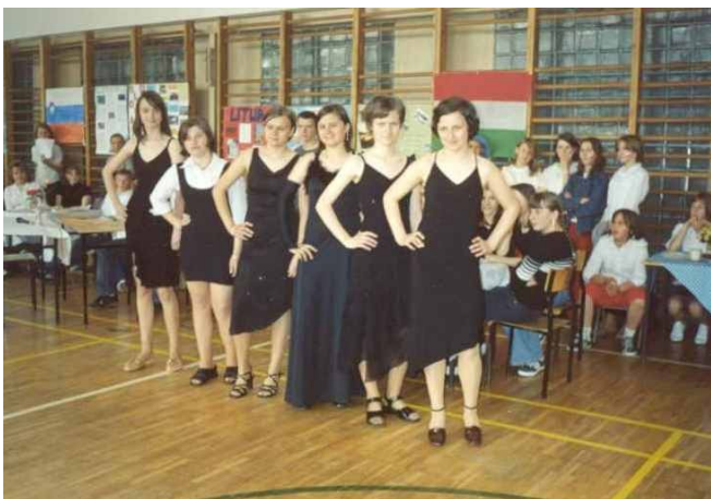
Oto najpiękniejsze uczennice z klasy II B G reprezentujące Maltę! Z dużym wdziękiem i gracją wcieliły się w role kandydatek na Miss Word