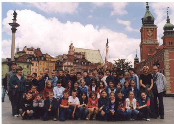
Dzieciaki ze Szkoły Podstawowej w Grodzisku z opiekunami oraz przewodnikiem na Starówce

Ostatnia wspólna wyprawa w Polskę III klas gimnazjalnych. Od czerwca ich drogi się rozchodzą. Przed nimi szkoła średnia, studia, praca, dorosłość! Powodzenia!