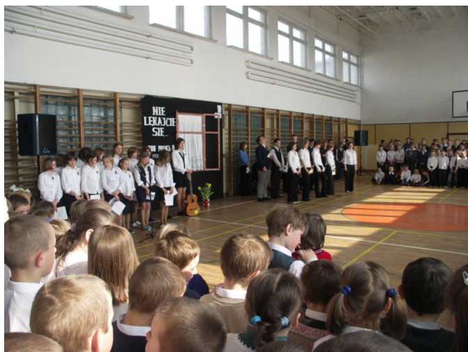
Okno symbolizujące spotkania Ojca Świętego z młodzieżą i wiernymi