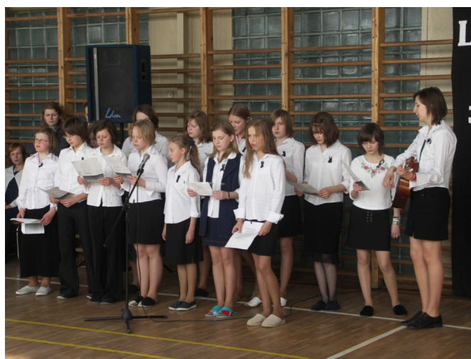
Nie mogło podczas tego apelu zabraknąć Barki, tak bardzo ukochanej piosenki Ojca Świętego