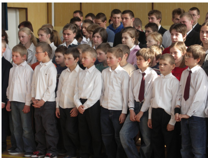
Prawie wszyscy uczniowie obecni na apelu na znak szacunku byli ubrani w stroje galowe