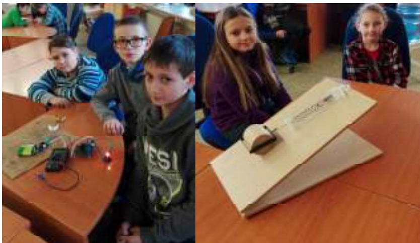
Vyrobili sme elektrický obvod