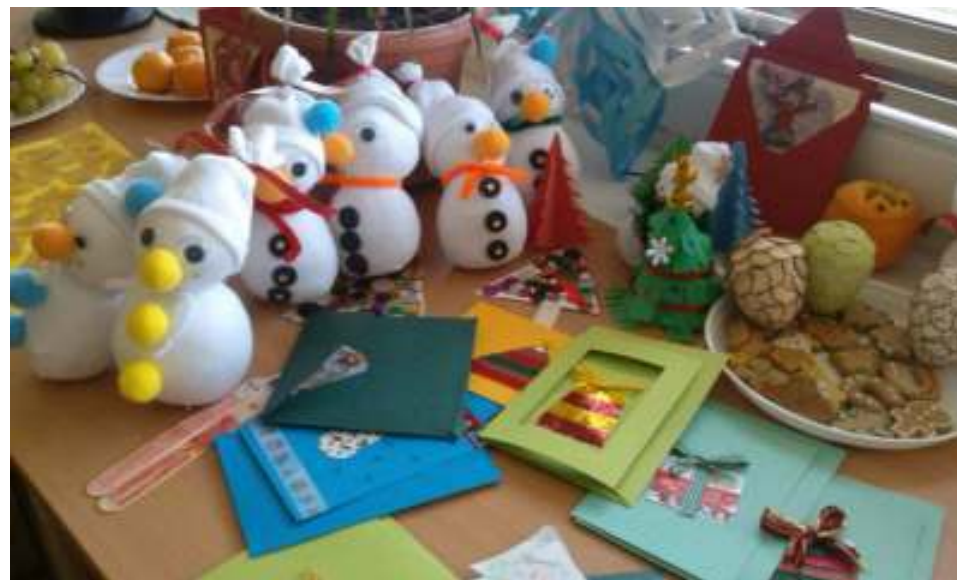
Autorka fotografie: Mgr. Majka Mažáriová