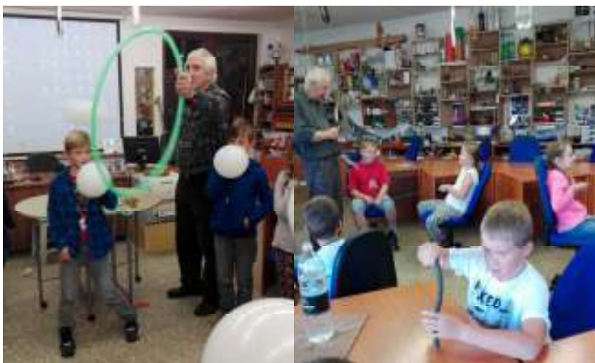
Gravitácia – prejde pohybujúci sa balón kruhom?