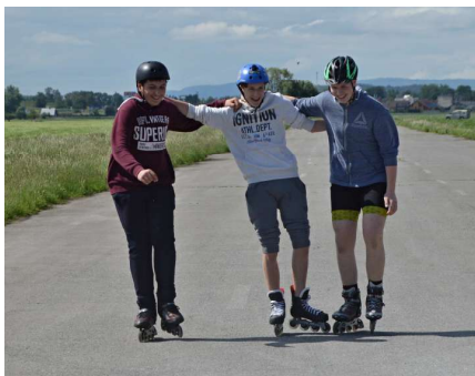
Cyklistické preteky CrossCountry v Košťanoch nad Turcom – 31. 5. 2019. Pohoda našich deviatakov. ☺