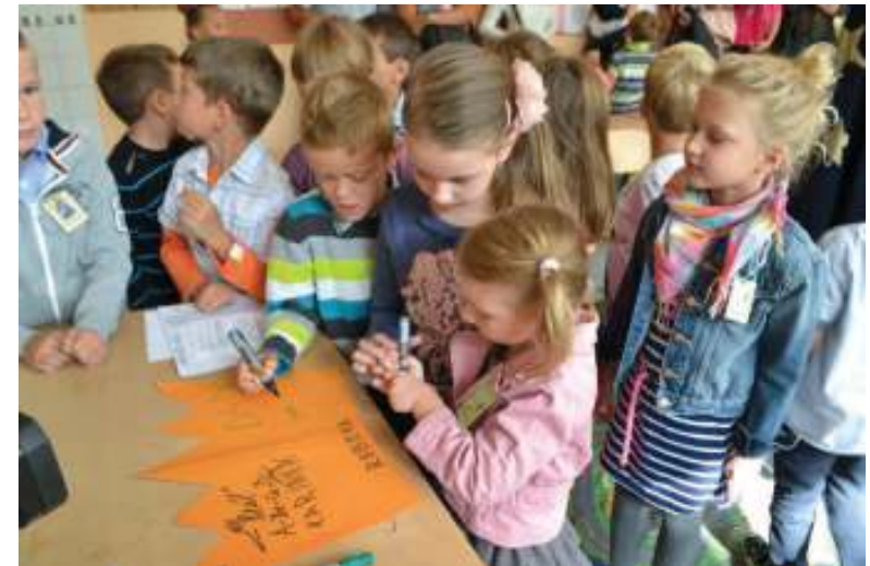
Naši šikovní prváci popísali kráľovskú korunu svojimi podpismi