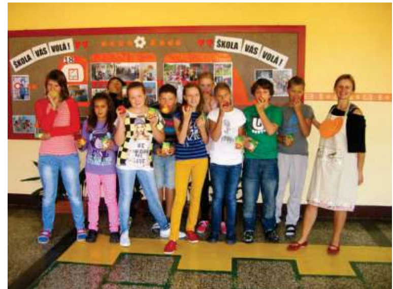
Ovocie neodmietnu ani šiestaci.

V našej škole sme začali realizovať vitamínový program Školské ovocie s podporou Európskej únie. Jedenkrát týždenne dostávajú naše deti čerstvé ovocie a ovocné šťavy od dodávateľa Bukov – veľkoobchod ovocie a zelenina z Horelice Čadca.