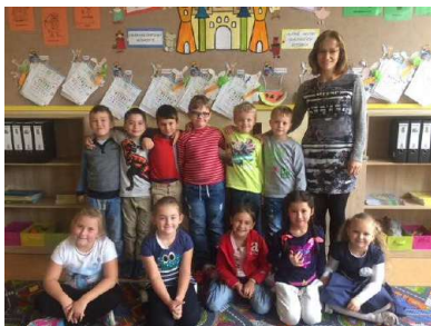
Trieda 1. SA