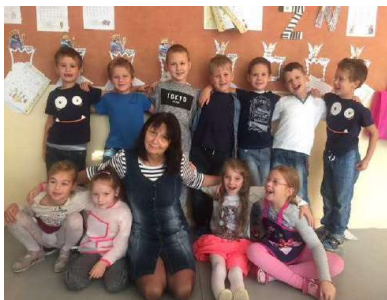
Trieda 1. S