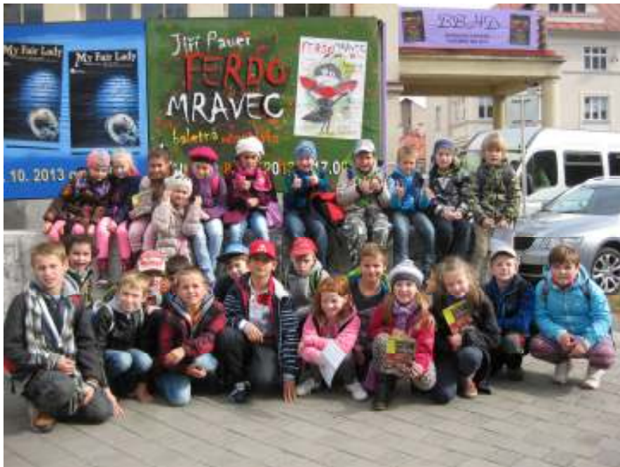
Druháci a tretiaci prežili 8. 10. 2013 v Banskej Bystrici pekný deň.