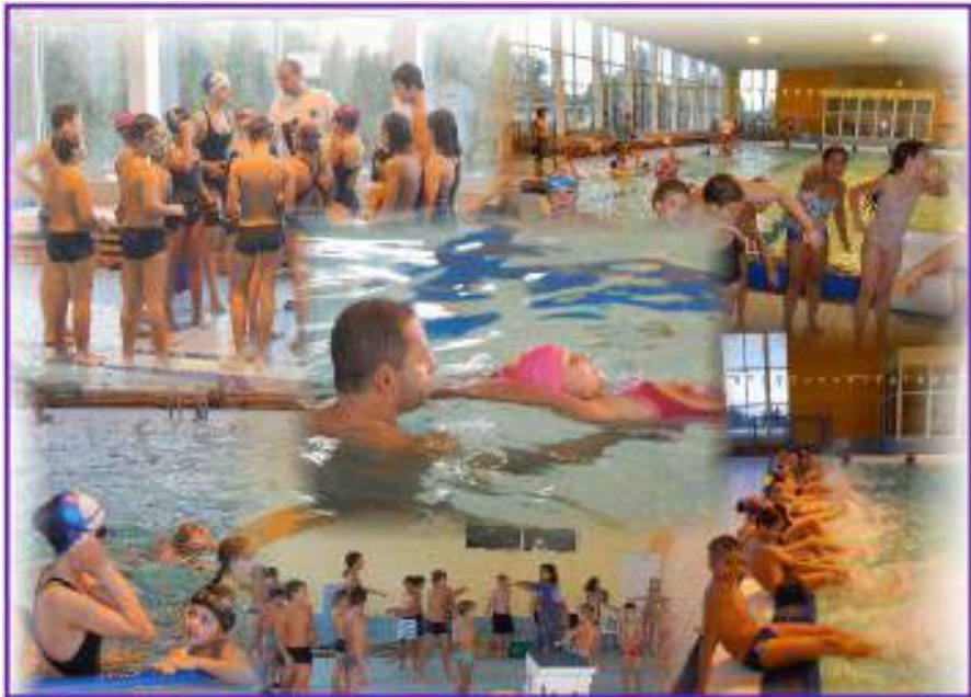
Na plaveckom bolo fajn.