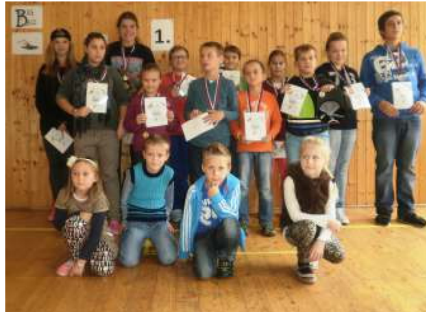
Galéria najlepších a najrýchlejších. V budúcom čísle prinesieme rozhovory.