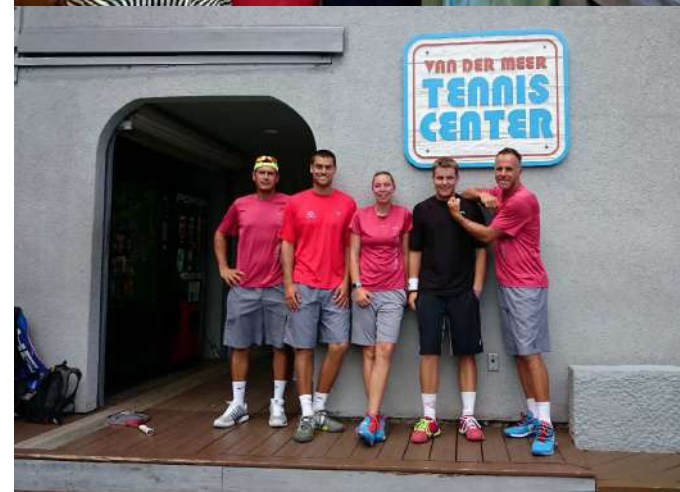
← Pred tenisovou akadémiou Van Der Meer