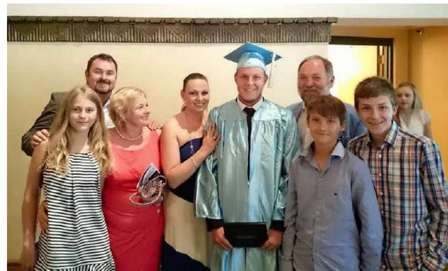
↑ Slávnostné ukončenie strednej školy