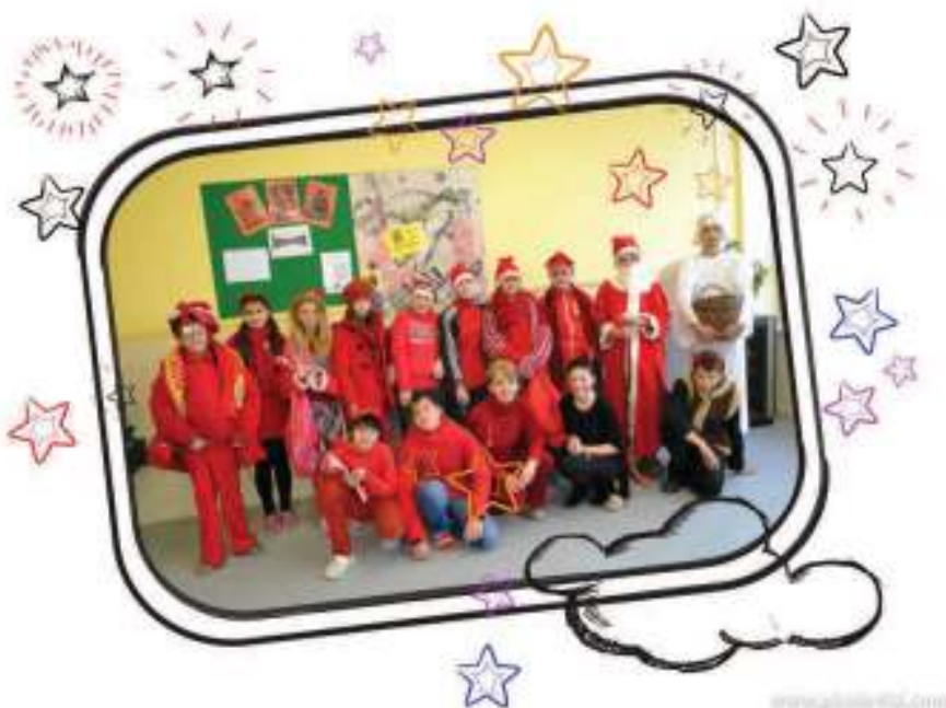
1. miesto – VI. S - 158 ks červeného oblečenia – priemer na žiaka – 14,36