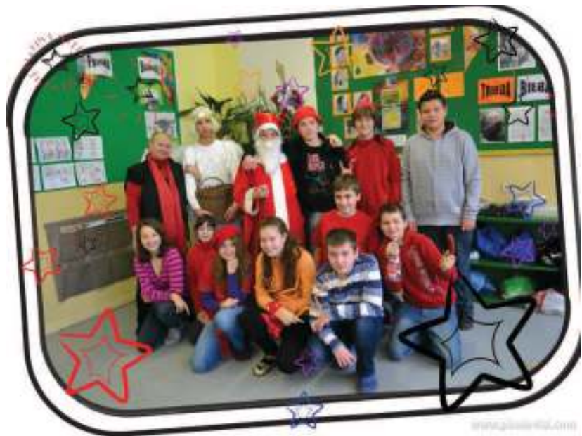
8. miesto – VIII. S – 35 ks červeného oblečenia – priemer na žiaka – 2,9