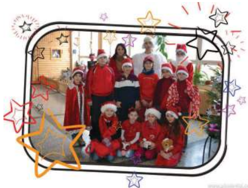
6. miesto – III. SA – 77 ks červeného oblečenia – priemer na žiaka – 11