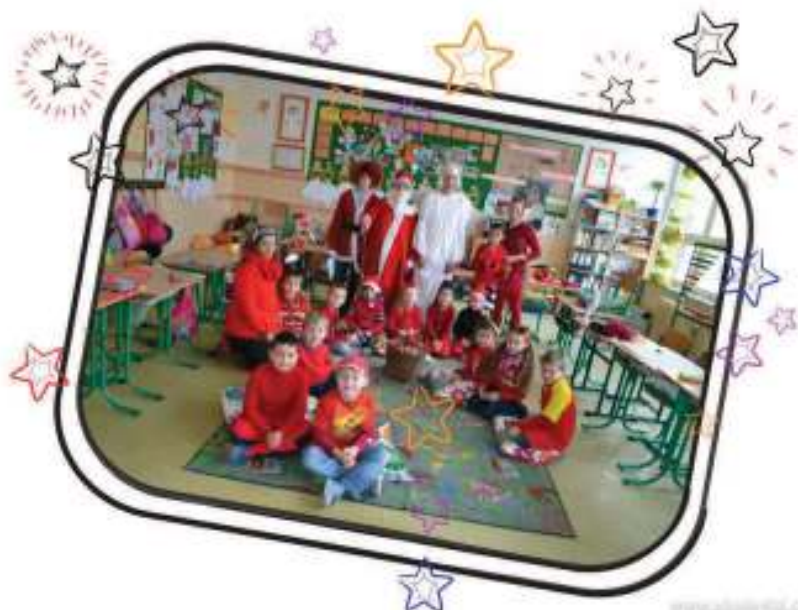
5. miesto – I. S – 106 ks červeného oblečenia – priemer na žiaka – 7,57