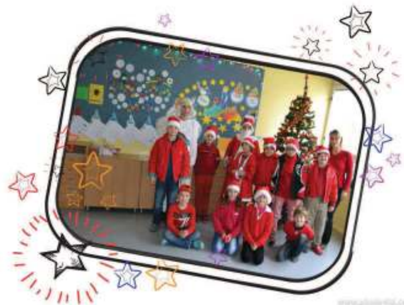
7. miesto – IV. SA – 80 ks červeného oblečenia – priemer na žiaka – 6,6