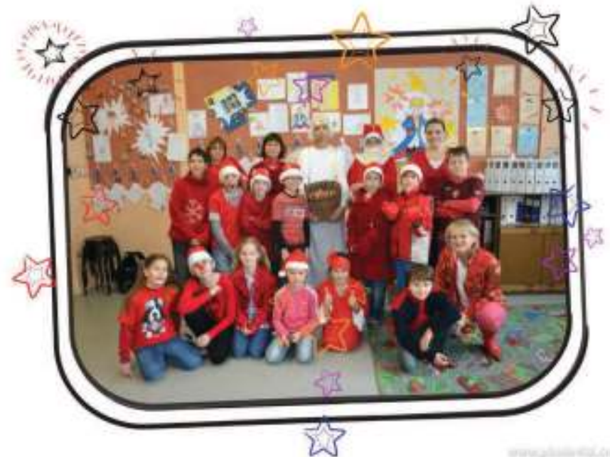
3. miesto – IV. S – 178 ks červeného oblečenia – priemer na žiaka – 13,69