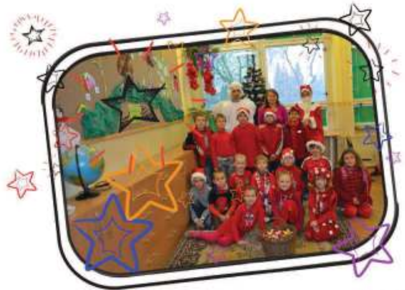
2. miesto – II. S – 207 ks červeného oblečenia – priemer na žiaka – 13,8