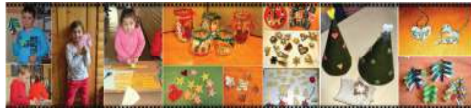
(Foto č. 1 – Prváčikovia si vyrobili takéto krásne stromčeky. Foto č. 2 – A toto je naša výsledná práca.)