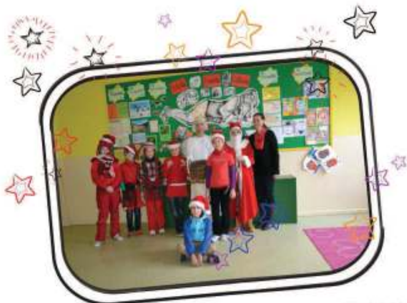
4. miesto – V. S – 84 ks červeného oblečenia – priemer na žiaka – 12