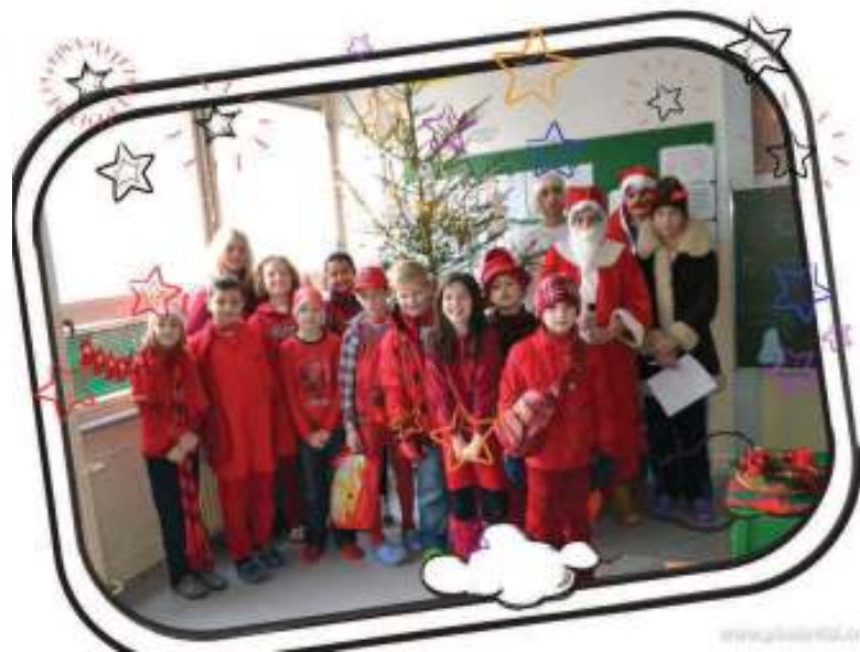
1. miesto – III. S - 158 ks červeného oblečenia – priemer na žiaka – 14,36