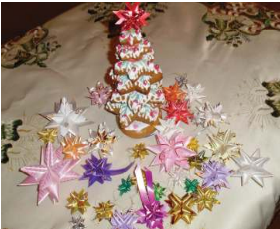
(Autorka fotografie i hviezdičiek matikárka Majka Debnárová)

Kým Evička urobila dve hviezdičky, Ivetka ich urobila tri. Spolu vyrobili 30 hviezdičiek. Koľko hviezdičiek urobila Evička?