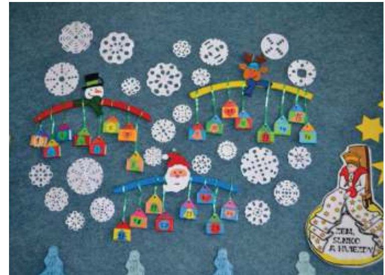
Prežili sme spolu krásny mikulášsky deň! Ďakujeme, školička naša! Ďakujeme, BellAmos!