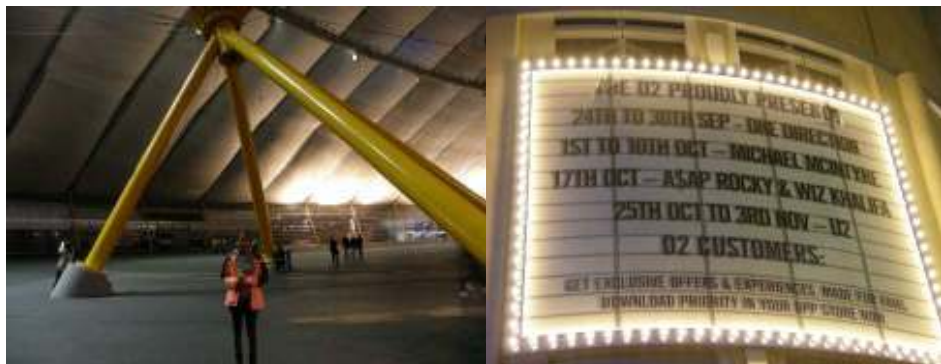
Foto 1 - 12 žltých podporných stĺpov O2 arény (pohľad zvnútra) Foto 2 - Program O2 Arény – 24 th to 30 th Sep – One Direction

Z a u j í m a v é je, že aréna má dookola 365m (ako dní v roku) a to, čo z nej trčí, sú podporné stĺpy vysoké 95m a je ich dvanásť! Áno, ako mesiacov v roku, alebo ako jedna hodina na ciferníku hodín. Spolu symbolizujú Greenwičský svetový čas. Tak to si zapamätám! Keďže je to O2 aréna, kto bude hlavný sponzorom? O2 predsa! Je to jeden obrovský stan, kde je veľa super reštaurácií, hudobných klubov (v jednom na mega veľkých obrazovkách púšťali koncert 1D) – kde majú výborné sushi, alebo nando's ☺ Nájde tam aj múzeum Elvise Presleyho! Hala má kapacitu 25 000 miest a v roku 2014 predali najväčší počet vstupeniek na svete – 1.8 milióna, čím tromfli Glasgow, Manchester aj New York! Taký stan by sa nám veru zišiel aj v Martine. Konečne by aj k nám mohli prísť One Direction! V roku 2012 sa tam konala Olympiáda. Aréna sa vraj mení podľa toho, či je tam práve koncert, tenisový turnaj, box alebo basketbal. To je super husté! Je vraj možné aj vyšplhať sa na vrchol arény, niečo ako adrenalínový šport. Ešteže to nenapadlo maminu! Už nás vidím ako sa zamotaní v lanách štvérame po tej obrovskej streche a mamina do toho kričí:“ Švihnite si, musíme ešte stihnúť múzeum!“