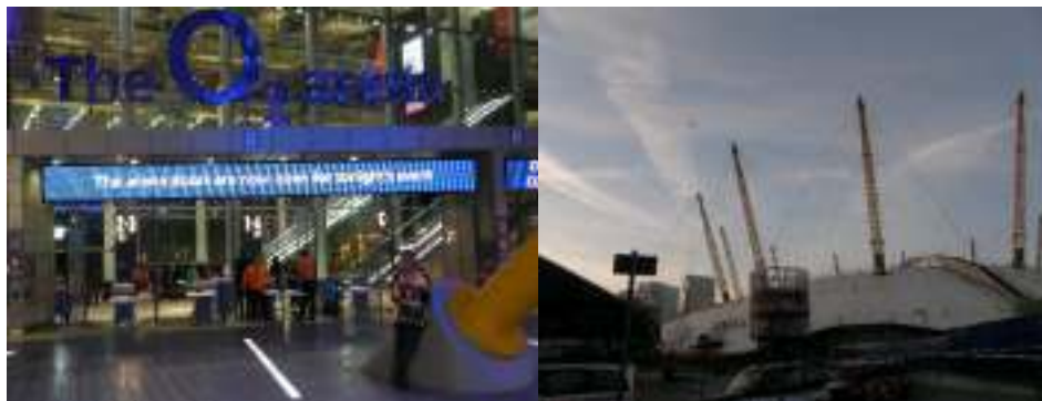
Vstup do O2 arény