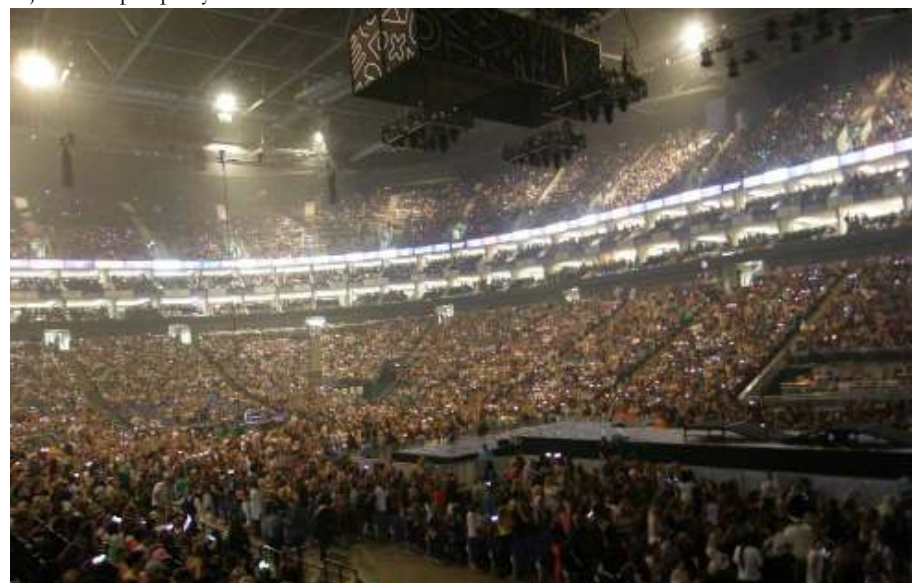
O2 Aréna a 1D family

„Musíme ísť na wécko“ a už sa začíname radit' na chvost obrovského hada – teda predstavte si, že sa celý BellAmos (deti, rodičia, učitelia a ich celé rodiny) postavia do rady na WC! Ani som nedovidela na koniec rady. Keby mi bolo naozaj treba, tak smola! V rade postávajú rodičia, deti a všade je strašný hluk a každý sa smeje, rozpráva a smeje. Mamy sa usmievajú na mamy a decká si obzerajú, kto je najlepšie nastajlovaný na koncert. (Ešteže mamina zobrala na chrbát ruksak 1D!) „Namaľujme sa!“ vykrikuje mamina a ja ju prosím pohľadom, aby sa konečne chovala ako dospelá! To by bol teda trapas! To by som neprežila! Jasné, že na mne by to vyzeralo prirodzene dobre, ale zmaľovaná tvár mamy ktorá jačí „Harry!“ to by bola celoživotná trauma! Mamina sa začne chichotať na čučoriedkach pred nami. To je názov pre nás – oddané fanynky!! To dievča vraví, že ak začnú hrať a ona bude trčať na záchode, tak sa tam radšej do neho spláchne! Druhá vraví, že na dospelých sa jednoducho nedá spoľahnúť! Prečo musia ísť aj ony, keď ich deti už čakajú pri východe?? Pobavilo ma to, ale tiež som mala nervy, kedy sa konečne dostaneme na rad! Toto sú chvíle, kedy váš život závisí od jediného úsmevu a pohľadu! Proste žiadny hlad, smäd a preplnené wécko!!!! Dospelí proste nič nechápu a nás deti to unavuje, ničो im neustále vysvetľovať! Vojsť do arény, kde je 20 000 ľudí je desivé! Totálne! Ale 20 000 fanúšikov 1D – to je ako super party s kamoškami!