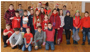
Vít'azná trieda 5. S v súťaži o najčervensiu triedu BellAmos.