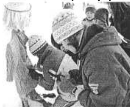
Zapínanie gombíkov jednou rukou