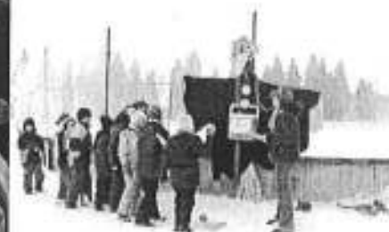
Hádzanie snehu do vrany