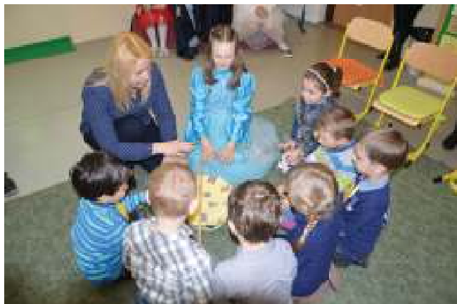
Čarovanie zo zázračného klobúka