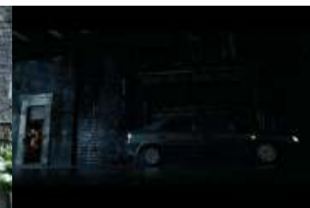
HP a väzeň z Azkabanu