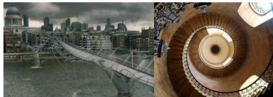
1st picture: HP a dary smrti I

This month you have to figure out what are these places and where in London they can be seen.