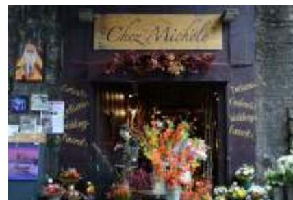
Kvetinárstvo na Borough Market

Keď sa vyberiete na Londýnske oko, cestou sa zastavte na Borough Market. Pamätáte si, ako Harry odišiel od rodiny Dudleyovcov a potom cestoval v čarodejníckom autobuse?