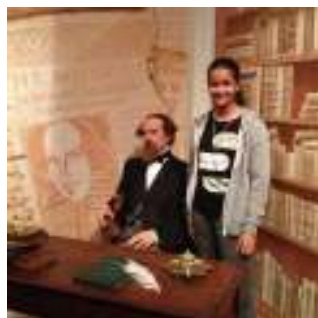
Ja s Dickensom

Druhý deň po príchode do Londýna sme si dopriali dlhší spánok – to znamená do ôsmej ☹. Mamina tento deň nazvala tématicky: „Nezabudni na mňa“. Najskôr si so starkou dopriala šálku kávy, čo mi vyhovovalo, lebo som si mohla ešte podriemať v posteli. Ako prvé sme sa vrhli na prehliadku mesta v mieste, kde sme bývali. „Ideme sa najesť!“, zahlásila mamina. Už cestou na hlavnú ulicu mi bolo čosi divné. Ženy, ktoré sme stretávali, mali na sebe farebné šály a na hlavách turbany z vlasov. Vyzerali ako sochy z Grécka. Chcem tým povedať, že sochári a to aj taký Feidiás by sa na ich hlavách poriadne namakal. Vošli sme do KFC a sadli si ku stolu. Nikto si nás nijak zvlášť nevšimol, zato my sme sa krútili na stoličkách a zízali sme na maminu, ktorá išla objednať jedlo. Očividne bola spokojná a vôbec jej to neprišlo čudné. „Sleduj ten odlišný akcent!“ No jasné mami, veď pracujem v jazykovednom ústave! Aby ste rozumeli, komunita, ktorá bývala v meste bola čiernej farby pleti. „Je to čudné byť iná ako ostatní?“, opýtala som sa neskôr, ako sme tak kráčali po hlavnej ulici. „Prečo?“, spýtala sa mamina a dodala: „Čudný by bolo, keby sme všetci vyzerali rovnako.“ A začal sa výklad o pocite, ktorý sa volá kultúrny šok a každý, kto príde do nového, odlišného prostredia ho zažíva a časom si naň zvykne.