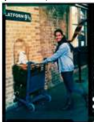
Nástupište 9 a 3/4

Spomínate si, ako sa Ron, Hermiona a Harry ocitajú vo svete muklov a takmer ich prešiel autobus?