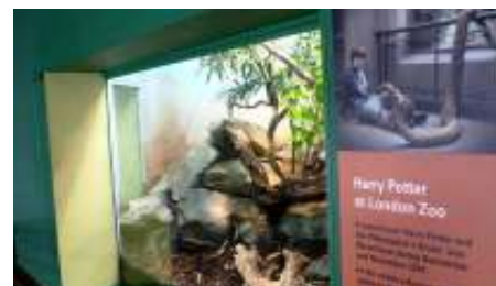
London Zoo – Reptile House

London ZOO - sem môžete vraj zájsť, keď už naozaj nebude mať kam ísť. Ale scéna s hadom je nezabudnuteľná. Harry prvýkrát čaruje ☺. Avšak Leadenhall Market nevynechajte. Je to úžasná budova. A nápad na Šíkmú uličku, kde si Harry kúpil prvý prútk bol na svete! ☺