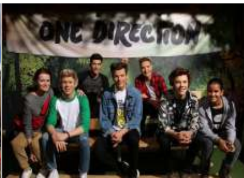
Ja, mamina a 1D

Úžasné na Tussaud's je to, že po náročnom foteaní môžete nasadnúť do jedného z taxíkov (black cab) a ten vás prevezie históriou Londýna. Samozrejme za pomoci figurín. Alebo sa môžete usadiť v kine a pozrieť si krátky film o tom, ako Hulk a Spiderman zachránia toto geniálne múzeum.