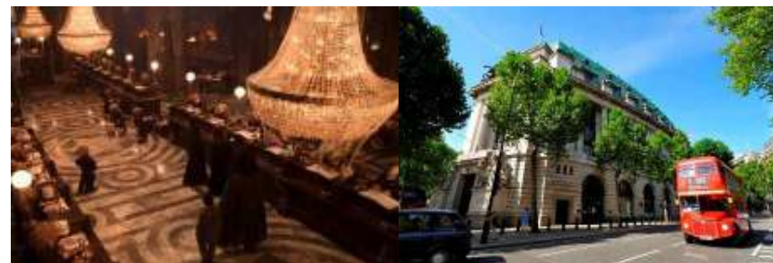
Harry Potter a kameň mudrcov

Australia House - vo vnútri tejto budovy sa nachádza Gringottská – čarodejnícka banka. Dnu sa zrejme nedostanete vďaka škriatkom – sú dost' nepriateľský, preto Vám navrhujem iba cestu okolo v autobuse.