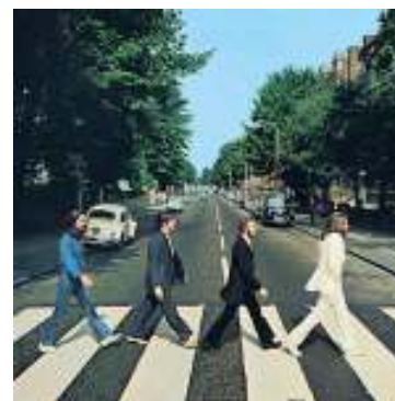
Beatles na prechode Abbey Rd

A čo Abbey Road? Prešli ste už túto slávnú zebru? Nie – no ja, áno!