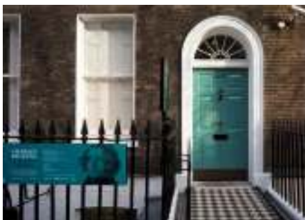
Charles Dicken's Museum

Dickens napísal krásnu poviedku – Vianočná koleda, ktorú si môžete prečítať, alebo si ju môžete pozrieť na našom konceročnom predstavení.