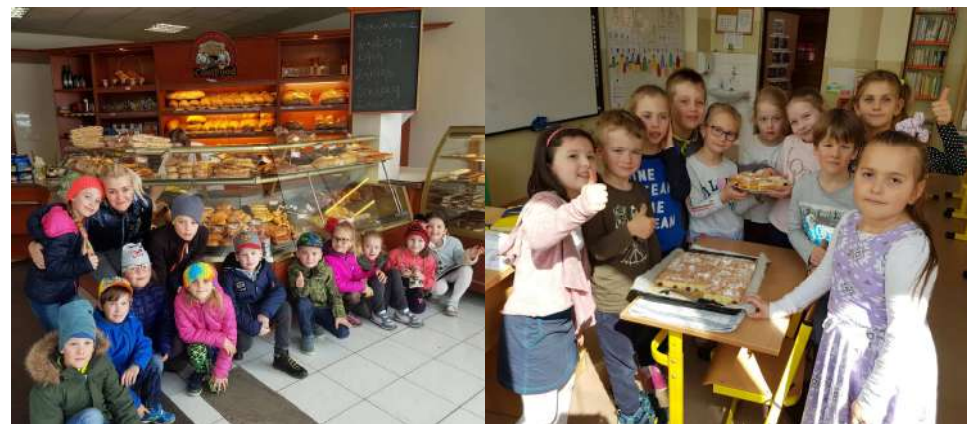
Prváci v Kremnickej pekárni

Upečený piatok zavŕšil náš voňavý niekoľkodenný plán integrovaného tematického vyučovania. Za rána sme sa na matematike pripravovali na finančnú náročnosť pečenia. Zistovali sme, koľko eur budeme potrebovať na nákup potrebných surovín a pomôcok na voňavé pečenie. Na čítaní nás zaujal príbeh o pečení chlebička, pozreli sme si video o jeho výrobe a pečení kedysi a dnes. Po voňavej prestávke Ham-Mňam, kde si deti podľa vône so zavretými očami zistovali, kto má čo na desiatu, čakalo naozajstné voňavé vyvrcholenie – pečenie bublaniny. Využili sme najvhodnejšie miesto, ktoré umožnilo skúsenosti typu tu a teraz, našu školskú kuchynku.