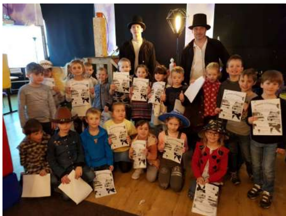
Prváčikovia v Písmenkove