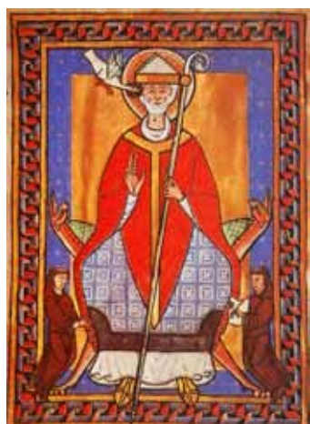
Grzegorz VII, papież w latach 1073-1085

Do zasadniczych punktów reformy gregoriańskiej należało rozdzielenie władzy świeckiej i duchownej. Papieża mieli odtąd wybierać nie cesarze ani rzymska arystokracja, ale kolegium kardynałów (tak jest do dzisiaj). Władza świecka straciła też prawo nominowania biskupów. Duchowieństwo zostało zobowiązane do celibatu (beżeństwa). Podkreślono na nowo nierozzerwalność małżeństwa i postulat dobrego wypełniania obowiązków związanych z życiem w rodzinie i pracą.